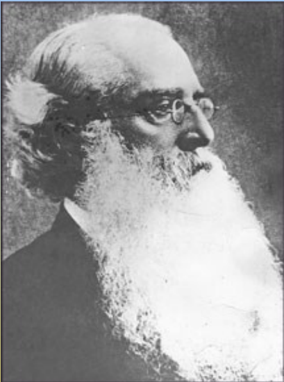
හෙන්රි ස්ටීල් ඕල්කට් තුමා

මූලබිජය හෙන්රි ස්ටීල් ඕල්කට් මැතිතුමාගේ සිත තුළ පහළ වූ බවට එතුමාගේ දිනපොතේ සටහන් කර ඇති පහත ප්‍රකාශය සාක්ෂි දරයි. “මගේ සිතට වැදගත් අදහසක් පහළ විය. බෞද්ධ ළමයින් ඔවුන්ගේ ආගම දිවයිනේ තිබෙන සෑම විහාරස්ථානයකදීම විශේෂ දින වල නියමිත පැය ගණනක් උගත යුතුය.”