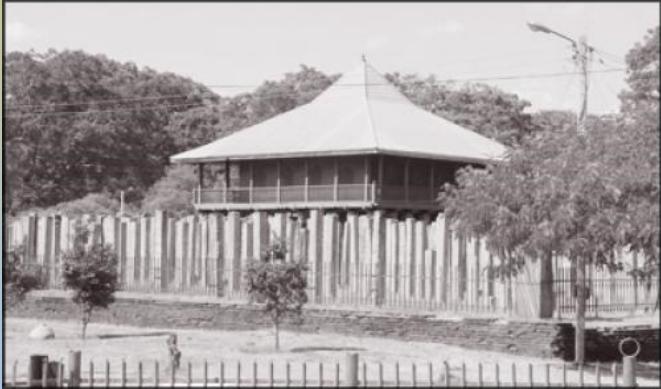
මේරවාද බුදුසමයේ කේන්ද්‍රස්ථානය වූ අනුරාධපුර මහා විහාරය

මහින්දාගමනය මෙරට ආගමික සාමාජික සහ සංස්කෘතික ක්ෂේත්‍රයන්හි පමණක් නොව අධ්‍යාපන ක්ෂේත්‍රයෙහි ද මහත් වෙනසකට හේතු විය. අනුරාධපුර මහමෙව්නා උයනෙහි මිහිඳු මහරහතන් වහන්සේගේ පුරෝගාමීත්වයෙන් ආරම්භ කරන ලද මහා විහාරය ලක්දිව ප්‍රථම විහාරස්ථානය මෙන් ම ප්‍රථම අධ්‍යාපන මධ්‍යස්ථානය ද වශයෙන් හැඳින්විය හැකිය. බුදු දහම පිළිබඳව ශ්‍රී