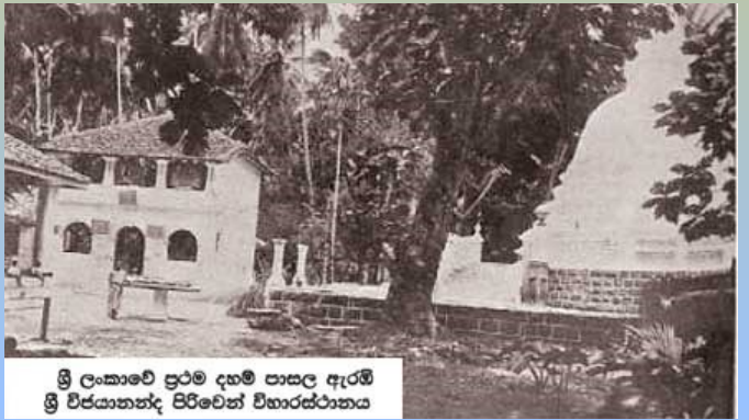
ශ්‍රී ලංකාවේ ප්‍රථම දහම් පාසල ඇරඹී ශ්‍රී විජයානන්ද පිරිවෙන් විහාරස්ථානය

වීදියේ පරම විඥානාර්ථ බෞද්ධ සමාගම් කාර්යාලයේ ආරම්භ කළ බව එම සමාගමේ සියවස් ප්‍රකාශනයේ සඳහන් වේ. ගුරු හිඟය නිසා එම දහම් පාසල අක්‍රිය වී ඇති අතර 1884 දී ආනන්ද විද්‍යාලයේ විදුහල්පති ලෙඩ්බ්ටර් මහතා විසින් නැවත ආරම්භ කරනු ලැබුවත් ටික කලකින් එයද අක්‍රිය වී ඇත. ඕල්කට්තුමාගේ සංකල්පයට අනුව 1895 අගෝස්තු මස 3 වැනි දින ගාල්ලේ වැලිවත්තේ විජයානන්ද විහාරස්ථානයේ පූජ්‍ය ඇහැලේපොල ජිනෝරස ස්වාමීන් වහන්සේගේ මූලිකත්වයෙන් ආරම්භ කරන ලද විජයානන්ද දහම් පාසල සංවිධානාත්මකව විහාරස්ථානයක ආරම්භ වූ ප්‍රථම ඉරුදින දහම් පාසල වන හෙයින් නූතන දහම් අධ්‍යාපනයේ